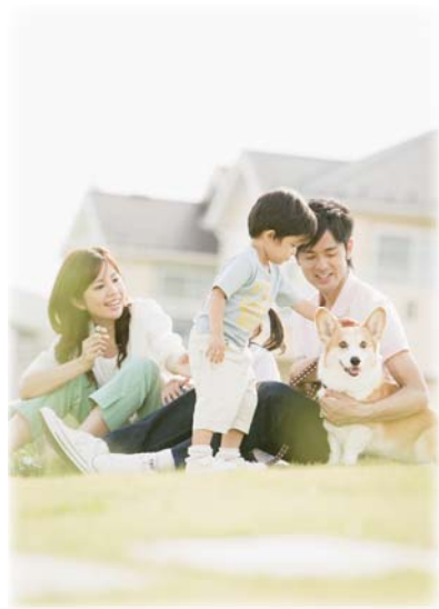
ペットは大切な家族ですね。妊娠期間中のペットのお世話も、できるだけご家族の協力を仰ぎましょう。きつと可愛いわんちゃん、ねこちゃんもわかってくれるはずですよ。

あかちゃんも脳の基礎が作られ始めています。論理的思考や問題解決、記憶の形成や蓄積を行う前脳。電気的信号を最終目的地へ送る送電線のような中脳。呼吸や心拍、脳の筋肉の働きを制御する後脳の3つにわかれます。こんなに大げさな事なのですが、それが行われているのがご飯粒より少し大きい、タイ米クラスの4〜8ミリメートルなのです。ですから神秘的ですね。 さてさて、妊婦さんの中には「ペット」と家族同様に生活している方も多いでしょう。 妊娠期間中、お肉やハンバーグの焼き加減には気をつけますが、ペットの糞尿に気をつける